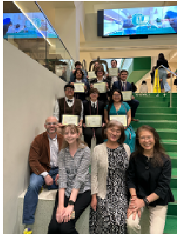
授章式後記念の一枚。先生方と。

今回は、授賞式にご家族や友人が多数参加してくださり、新記録となりました。先輩・後輩や仲間、家族に祝福され、これまでの勉強の努力や活動の成果を式では各自に語ってもらいます。家族を前に話している時、感極まって涙にकुれてしまうという学生も今回はじめてあり、色々な感動の初めてが続いた式になりました。