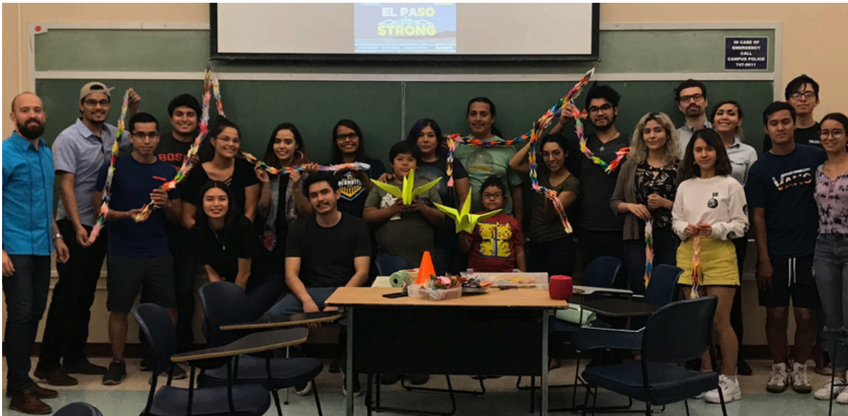
Japanese language Students at the University of Texas at El Paso making senbazuru to honor the victims. (August 5th, 2019)