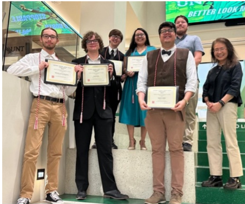
春学期の授章式にはご家族、友人も多数参加していただきました

チャプターの活動や運営に関しては様々な形がありますが、今後も他大学や色々な honor society の活動からも学んで指導をしていきたいと思っています。本学には、スペイン語の歴史あるソサエティもありますので、共同で何かのチャリティ活動を実施したり、運営方法などを学んだり、オフィサーから学生同士で学んだりの機会を支援できたらと考えています。日本語の枠にとどまらず、他の言語のオナーソサエティからも、知見を得ていけるよう、伸びやかな、社会ともつながる学生たちのための J N H S 活動を推進していきます。