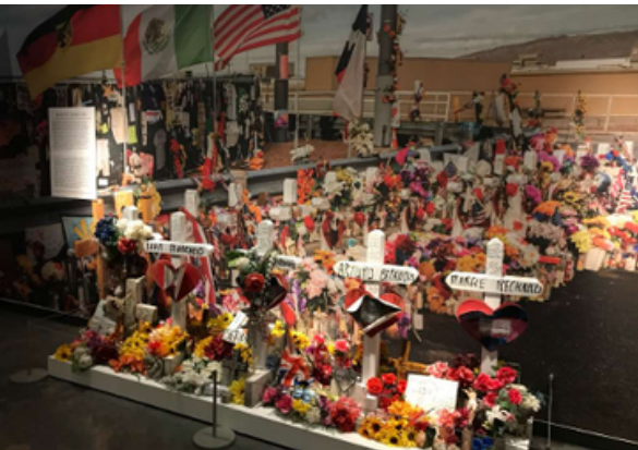
Above left: Exhibition: Resilience, Remembering August 3 rd . Part of the original origami made by the UTEP students.