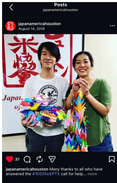
The Japan America Society of Houston joined the University of Texas at El Paso's Students in creating senbazuru for the August 3rd Community Memorial.

The presence of Fort Bliss also contributes to interest in Japanese language learning, as some individuals prepare for assignments at U.S. military bases in Japan.