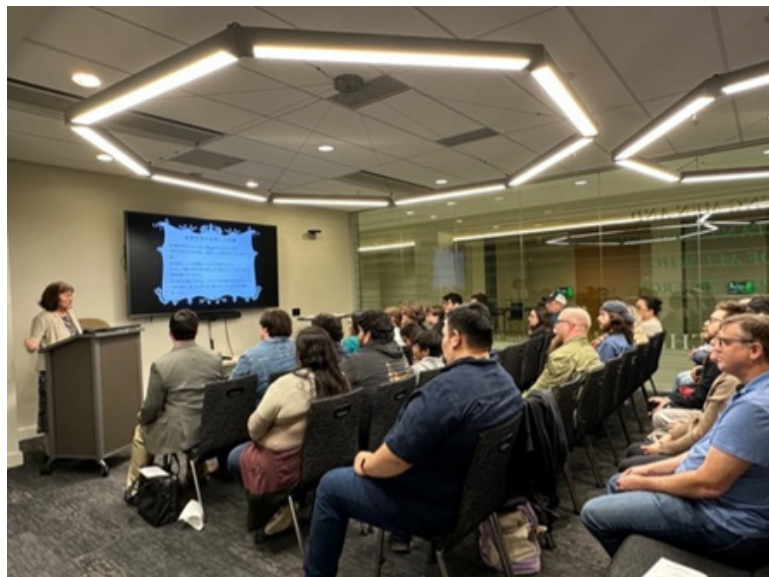
J N H S につながるクラブ活動を支えてくれたメンバーたち